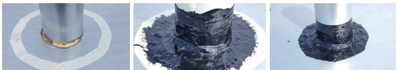
2 obróbka rury wentylacyjnej