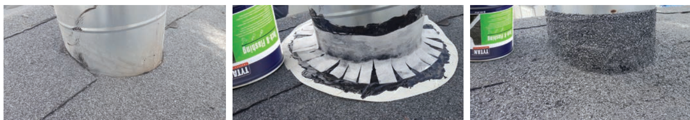
3 obróbka komina ze stali nierdzewnej